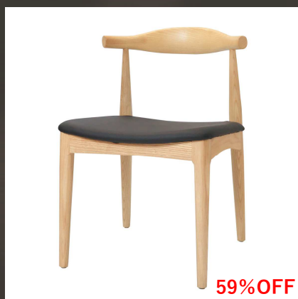
エルボチェアスクエア ナチュラル 77,000円→ 31,500円