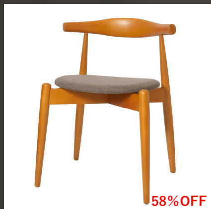
エルボチェアラウンド ファブリック ブラウン 80,000円→ 33,000円