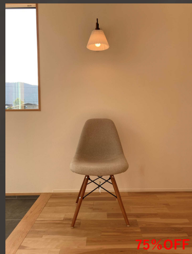
イームズシェルサイドチェア ファブリック ライトグレー 36,000円→ 9,000円