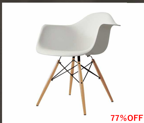
イームズアームシェルチェア DAW ホワイト 31,000円→ 7,000円