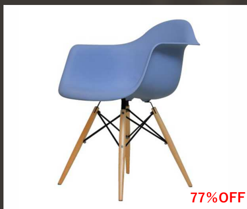
イームズアームシェルチェア DAW ブルー 31,000円→ 7,000円