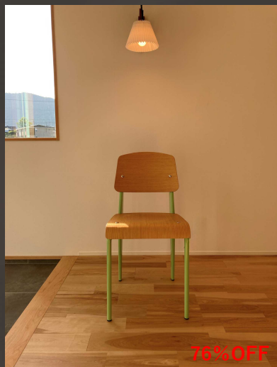
スタンダードチェアグリーン 56,000円→ 13,000円